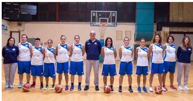
Figura 3: Squadra Senior Femminile