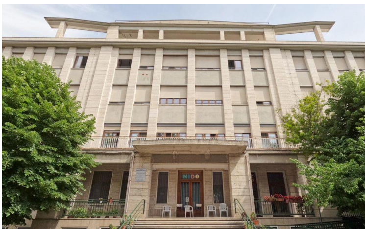
Figura 4: Esterno dell'ISTITUTO PREZIOSISSIMO SANGUE DI ASCOLI PICENO, dove le tre entità svolgono attività formativa, sportiva, di inclusione sociale. Nella struttura sono presenti 25 Bambini della Scuola Materna; 75 Bambini della Scuola Elementare; 50 Over 65/donne in maggioranza non autosufficienti; 12 Soggetti Disabili