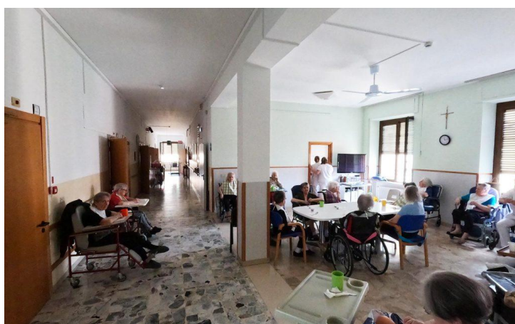
Figura 8: Alcuni degli anziani ospiti della struttura del Pensionato dell'Istituto