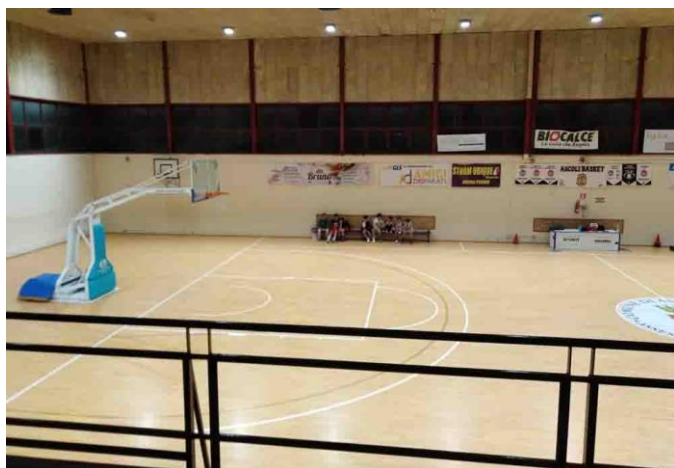
Figura 1: PALESTRA POLIVALENTE - PALABASKET di Ascoli Piceno: svolti campionati Under, Senior Maschile fino alla C Regionale e Femminile fino alla B, tornei federali e attività FIP – CONI