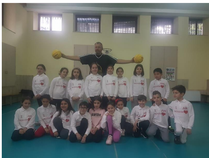
Figura 7: I Bambini del Minibasket dell'Istituto Prez. Sanguè AP con il nostro Istruttore M. di M.