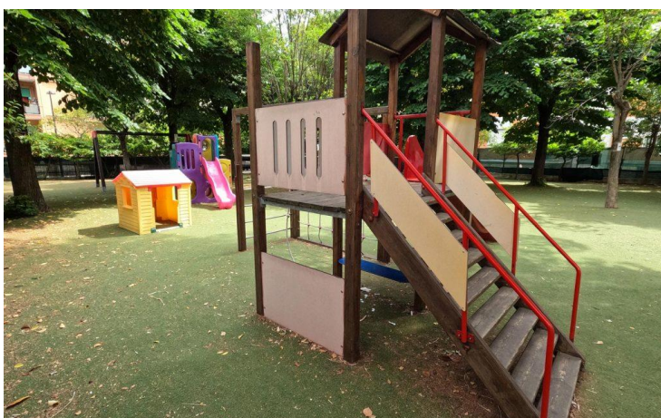
Figura 5: Esterni strutture scolastiche ove le tre entità svolgono le proprie attività