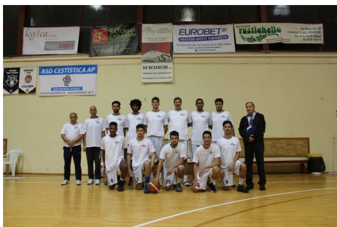
Figura 2: Squadra Senior Maschile