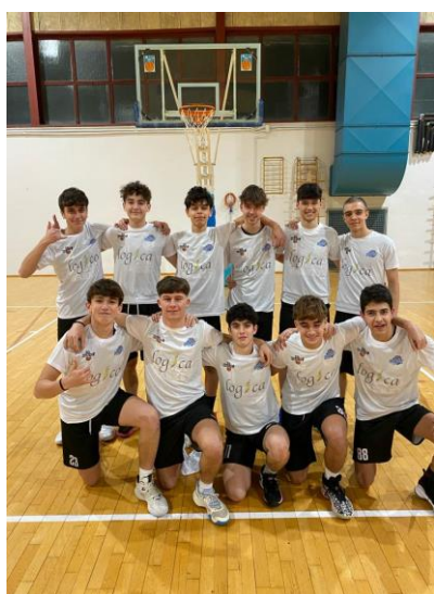
Figura 8: La Squadra Under 17 Maschile, MAIN SPONSOR "LOGICA SRL"